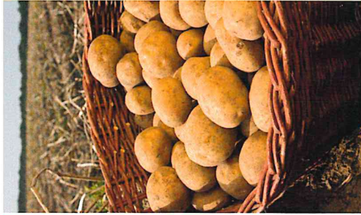
FrISChe und regionale Zutaten sowie Kartoffeln mit Bio-Zertifizierung sind fester Bestandteil unserer Speisen.